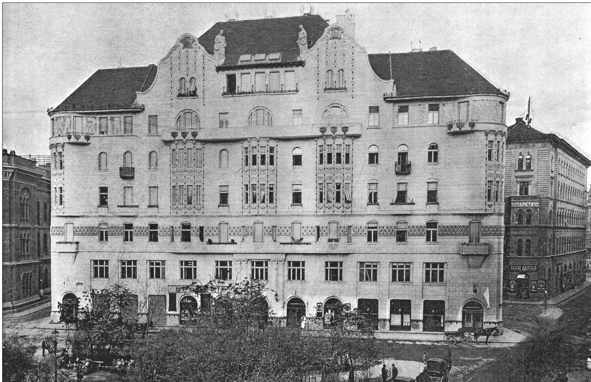
A Gutenberg Otthon főhomlokzata házavatáskor

A 38 elegáns kialakított lakást két tágas lépcsőház, személy- és teherfelvonó szolgálja. Teljesen elkülönítve ettől, a Kőlcsey és Bér-