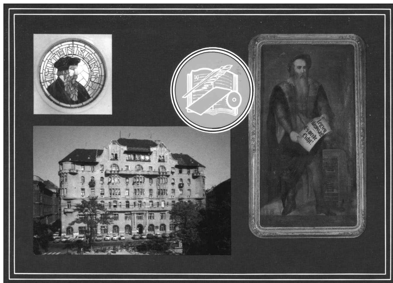
A Gutenberg Szakszervezeti Szövetség levelezőlapja

Ennyi. Olvashattuk, hogy a székházat az államosításakor elvették a nyomdásztól (társadalmi tulajdonba vették), és megengedték, hogy a Nyomdászszakszervezet bérlőként a saját házában ott maradjon. Negyven év múlva egy újabb rendszerváltáskor alkalom nyílt arra, hogy visszaszeresse a székházat a szakszervezet. Megtette. Tízévi próbálkozás után 2001-ben „visszakapta” de csak egy részét, a 33%-át. A VIII. Kerületi Tanács (ma Önkormányzat) úgy adta vissza, hogy előtte értékesítette a házban lévő lakásokat, amelyek lakbéré korábban eltartotta az épületet, plusz hasznolt hozott a szakszervezetnek... Az végső csapást a Gutenberg Művelődési Otthon Kht. vezetése mérte a Nyomdászszakszervezetre, amikor több mint tízmillió forint adósságot halmozott fel. Ezzel a szakszervezet pénzügyileg majdnem ellehetetlenült. Hogy a szakszervezet kifizesse az egyre halmozódó adósságot, kénytelen volt – túlélése érdekében – a székházat eladni. A szakszervezet ma ismét bérlő a székházban.